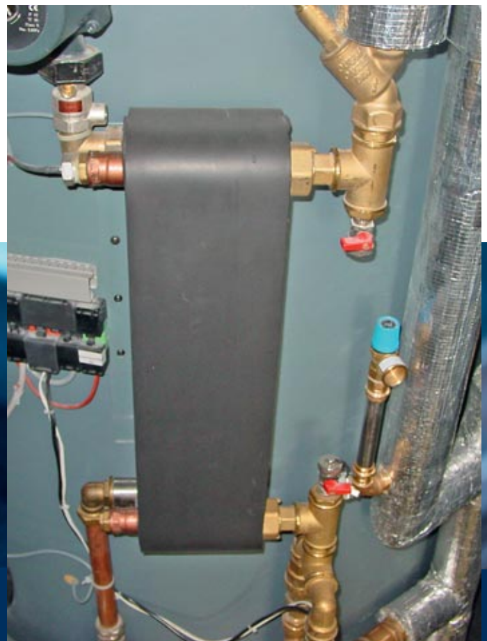
Die Pufferspeicher sind mit außenliegenden Plattenwärmetauschern ausgestattet.