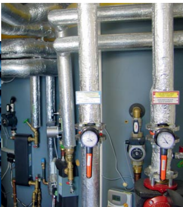
Zwei 1.500-Liter-Pufferspeicher und Hocheffizienzpumpen sorgen für Wärme komfort nach Maß.